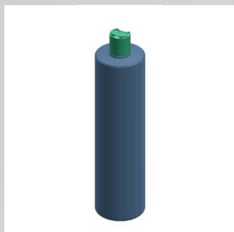
FRASCO GLOBAL 1000 ML PEAD

Veja mais especificações no site Clique aqui.