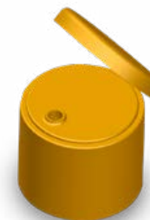
TAMPA FLIP-TOP ROSCA 18