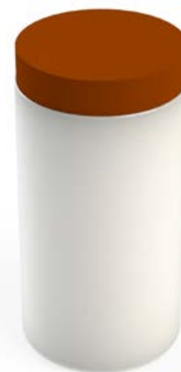
POTE 1 KG R90 PEAD