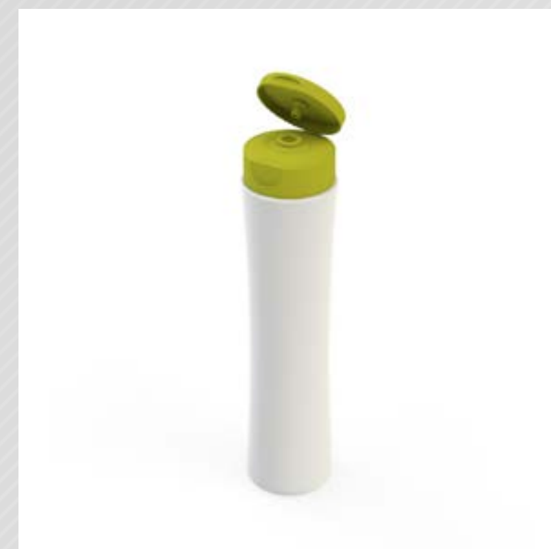
FRASCO ACINTURADO 300 ML PEAD