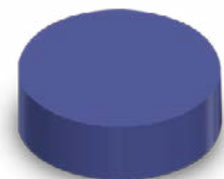
TAMPA ALTA ROSCA 90

Veja mais especificações no site Clique aqui.