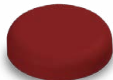
TAMPA TARTARUGA ROSCA 97