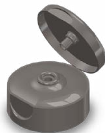
TAMPA FLIP-TOP ROSCA 22

Veja mais especificações no site Clique aqui.