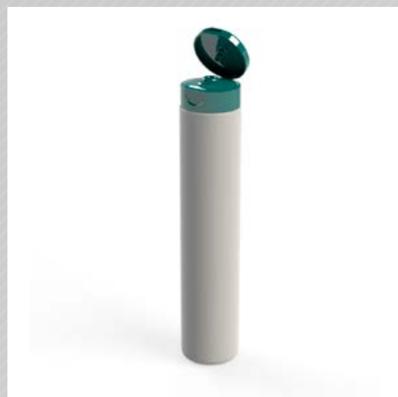
FRASCO CILÍNDRICO 400 ML PEAD