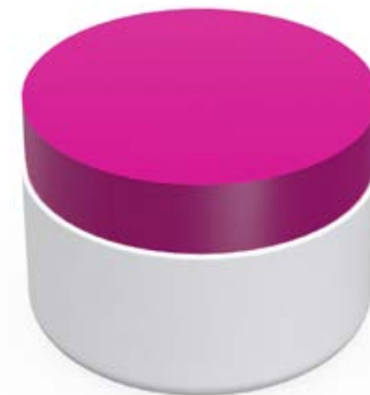
POTE 500 GRS PEAD