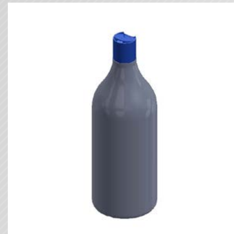
FRASCO CONE LINE 1000 ML PEAD