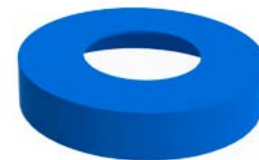
ANEL PARA FRASCOS CILÍNDRICOS: 500,750 E 1000 ML

Veja mais especificações no site Clique aqui.