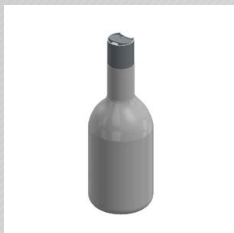
FRASCO CONE LINE 500 ML PEAD

Veja mais especificações no site Clique aqui.