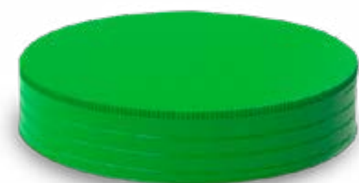
TAMPA ROSCA 90 RETRÔ