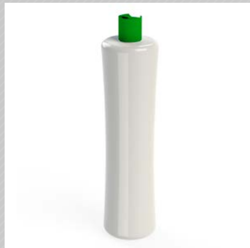
FRASCO ACINTURADO 1000 ML PEAD