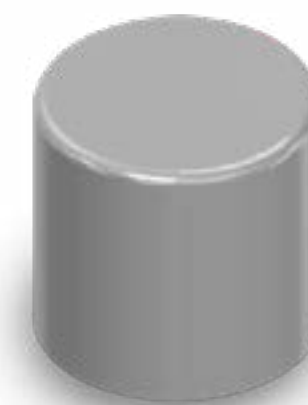
TAMPA ROSCA 18