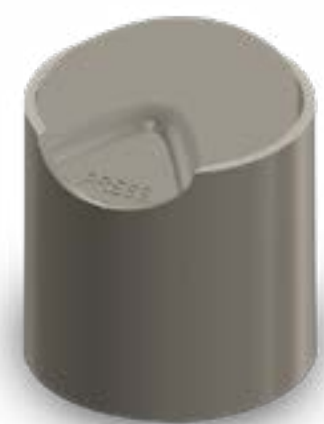
TAMPA DISK-TOP ROSCA 28/410