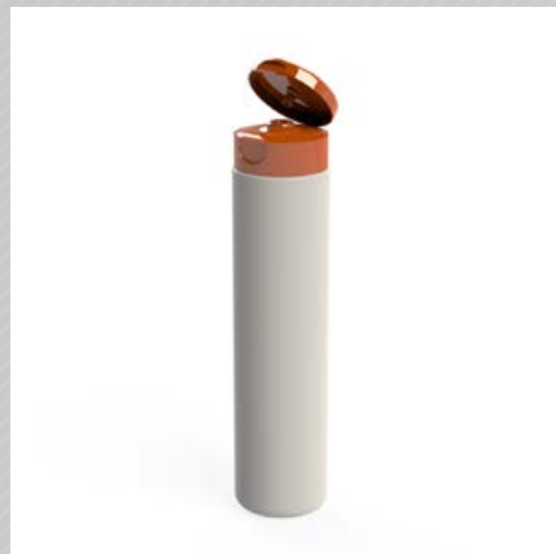
FRASCO CILÍNDRICO 300 ML PEAD