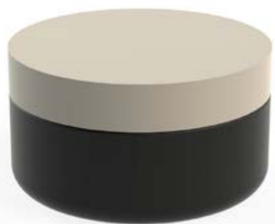
POTE 80 GRS PEAD