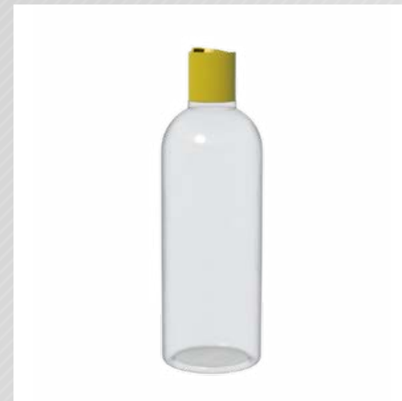
FRASCO MUNDY 500 ML PP