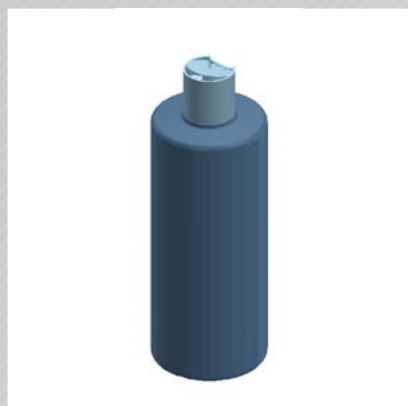
FRASCO GLOBAL 500 ML PEAD