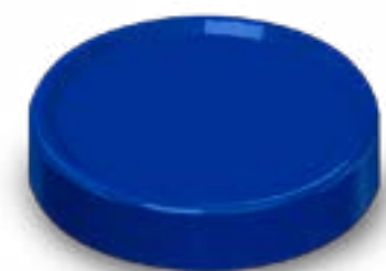
TAMPA ROSCA 63