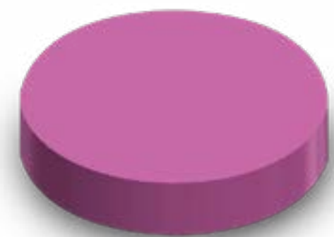
TAMPA ROSCA 90