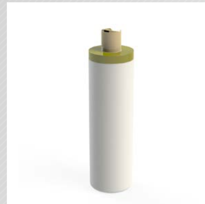
FRASCO CILÍNDRICO 750 ML PEAD