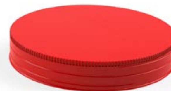
TAMPA ROSCA 70 RETRÔ