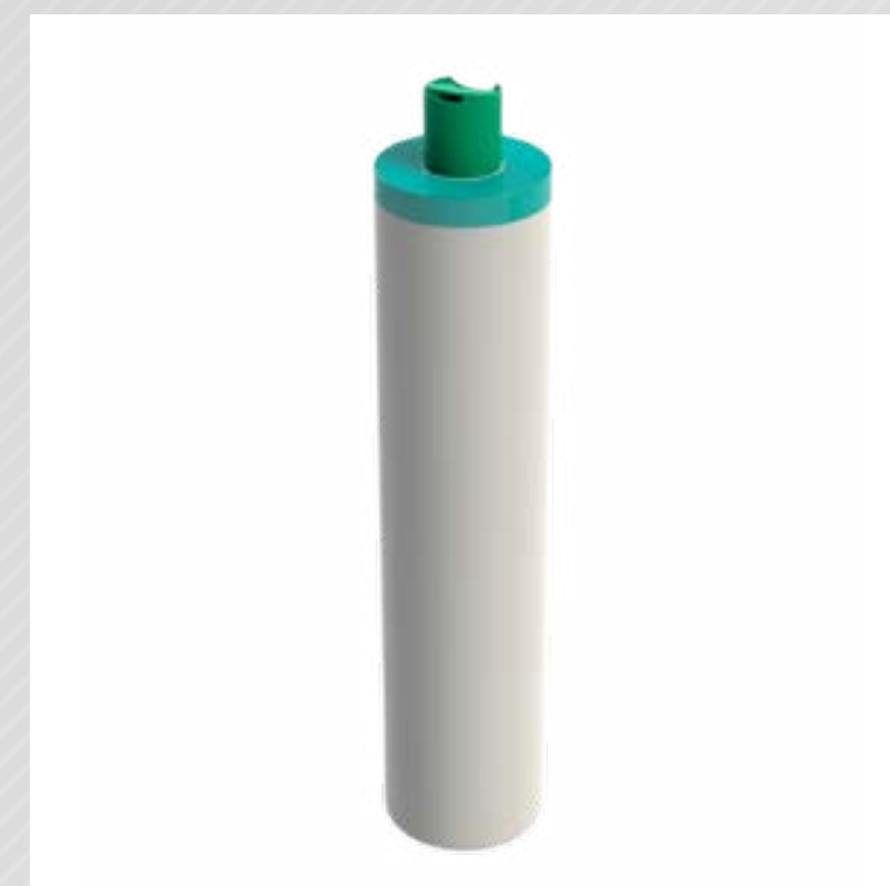
FRASCO CILÍNDRICO 1 L PEAD