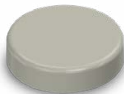
TAMPA ROSCA 53