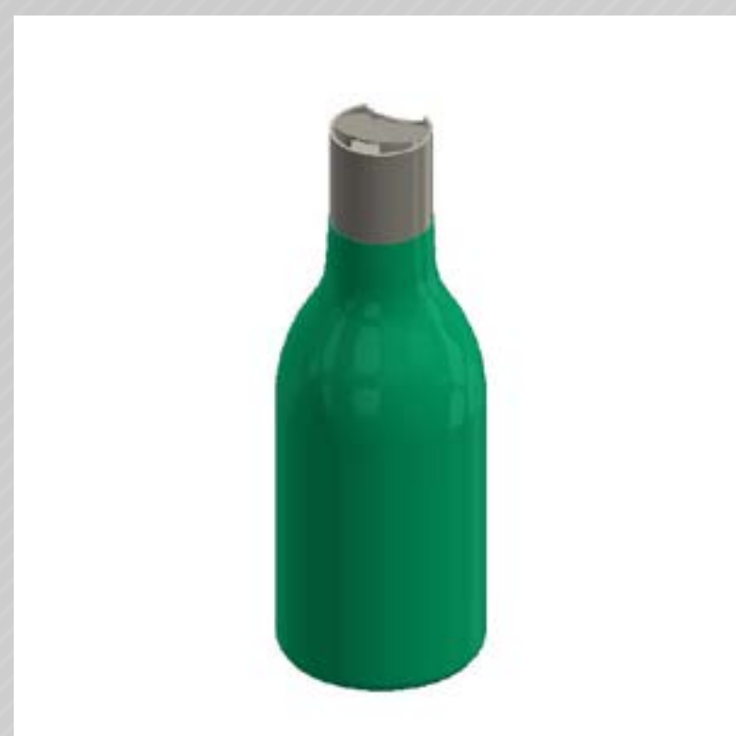
FRASCO CONE LINE 300 ML PEAD