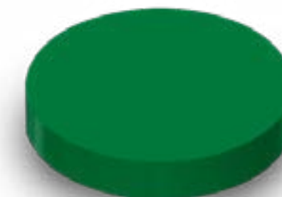
TAMPA ROSCA 110