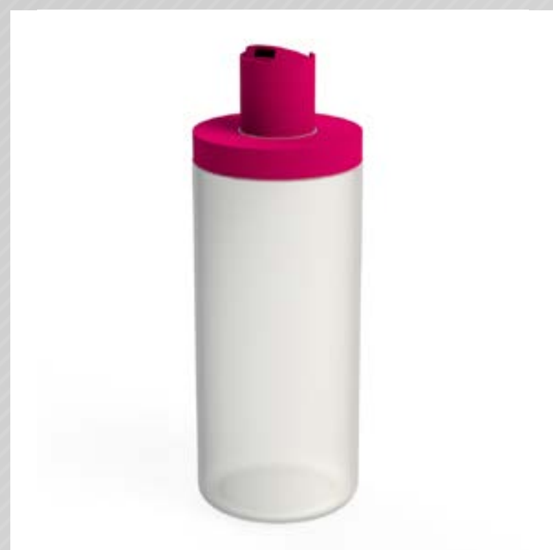
FRASCO CILÍNDRICO 500 ML PEAD

Veja mais especificações no site Clique aqui.