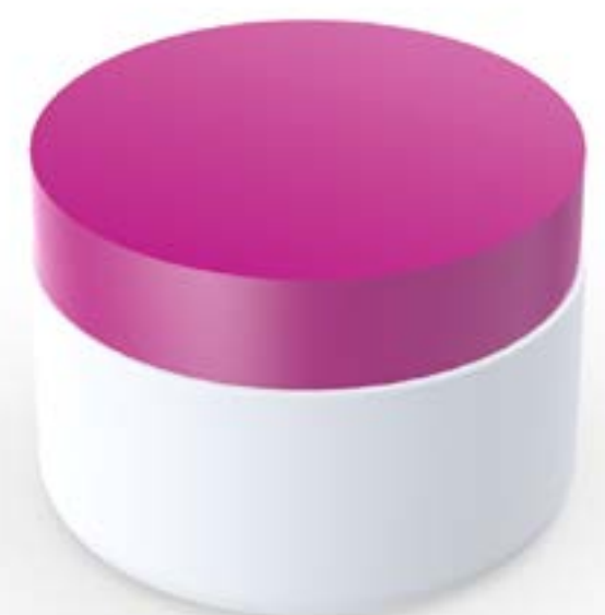
POTE 300 GRS PEAD

Veja mais especificações no site Clique aqui.