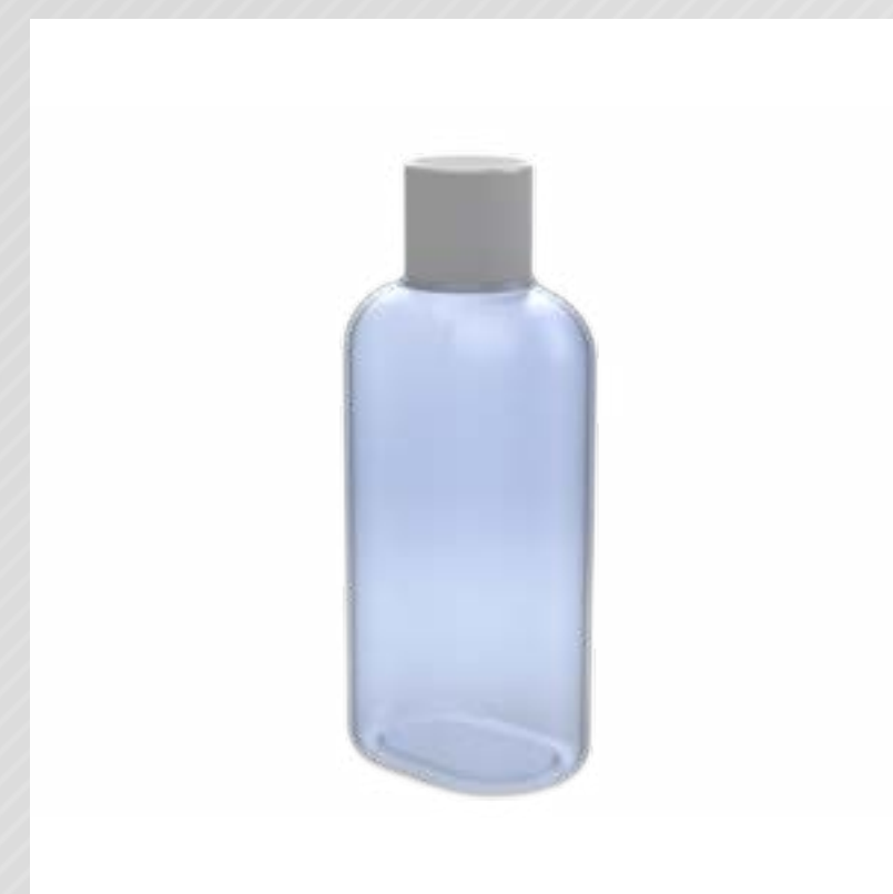
FRASCO 60 ML PVC