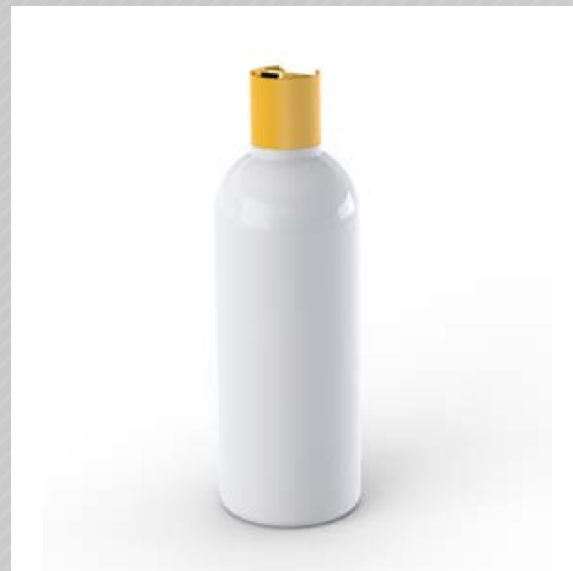
FRASCO MUNDY 500 ML PEAD